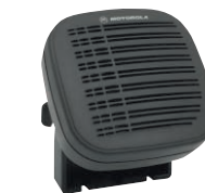
Внешний громкоговоритель 13Вт