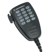
Микрофон с клавиатурой