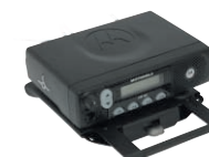
Переносной крепежный комплект

Универсальные мобильные радиостанции Серии С специально разработаны для чувствительных к ценам и динамичных рынков. Радиостанции серии С обеспечивают быструю передачу информации об обслуживании пассажиров и доставке товаров. Когда автомобиль не используется, радиостанцию можно легко и быстро снять, для этого предусмотрены соответствующие варианты крепления. Радиостанции имеют встроенные средства безопасности, благодаря которым работающие в одиночку сотрудники могут обратиться к коллегам за помощью или советом, нажав всего лишь одну кнопку. Наличие функции селективного вызова обеспечивает идеальные условия для переговоров между руководителем и определенным членом группы, и эти переговоры не мешают работать остальным членам группы.