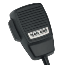
Mag One микрофон